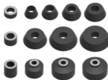
Kit de conos y espaciadores