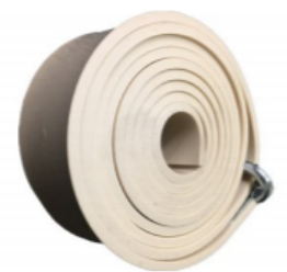
Correa para tambores